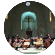
Orchestre de Violoncelles

contemporaine. Ardent interprète de la musique slave et propagateur, en particulier, de la musique de son pays d'origine, la Bulgarie, Svetlin Roussev s'est produit dans de nombreuses salles de concert telles que la Salle Pleyel, le Théâtre du Châtelet, le Théâtre des Champs-Élysées ou la Cité de la Musique et le palais de l'UNESCO à Paris, le Palais des Beaux Arts de Bruxelles, l'Alte Oper de Francfort, le Palais de la Culture de Budapest, Sumida Triphony Center Hall et Suntory Hall de Tokyo, le Seoul Arts Center, ou encore le Bolchoï de Moscou... Svetlin est lauréat de nombreux concours internationaux (Indianapolis, LongThibaud, Melbourne...). En 2000, il est Révélation Classique de l'Adami (Midem de Cannes) et lauréat de la Fondation d'Entreprise Natexis Banque Populaire. Refusant les clivages, Svetlin vient d'être nommé premier violon solo de l'Orchestre de la Suisse Romande, après avoir été violon solo de l'Orchestre Philharmonique de Radio France et Concert maister du Seoul Philharmonic Orchestra. Il est professeur de violon au Conservatoire National Supérieur de Musique et de Danse de Paris. Svetlin Roussev joue le Stradivarius "Camposelice" de 1710 prêté par la Nippon Music Foundation.